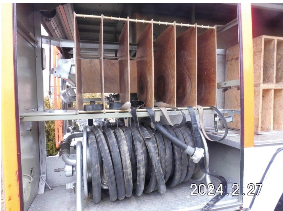
Zdj. 8. Zabudowa samochodu.