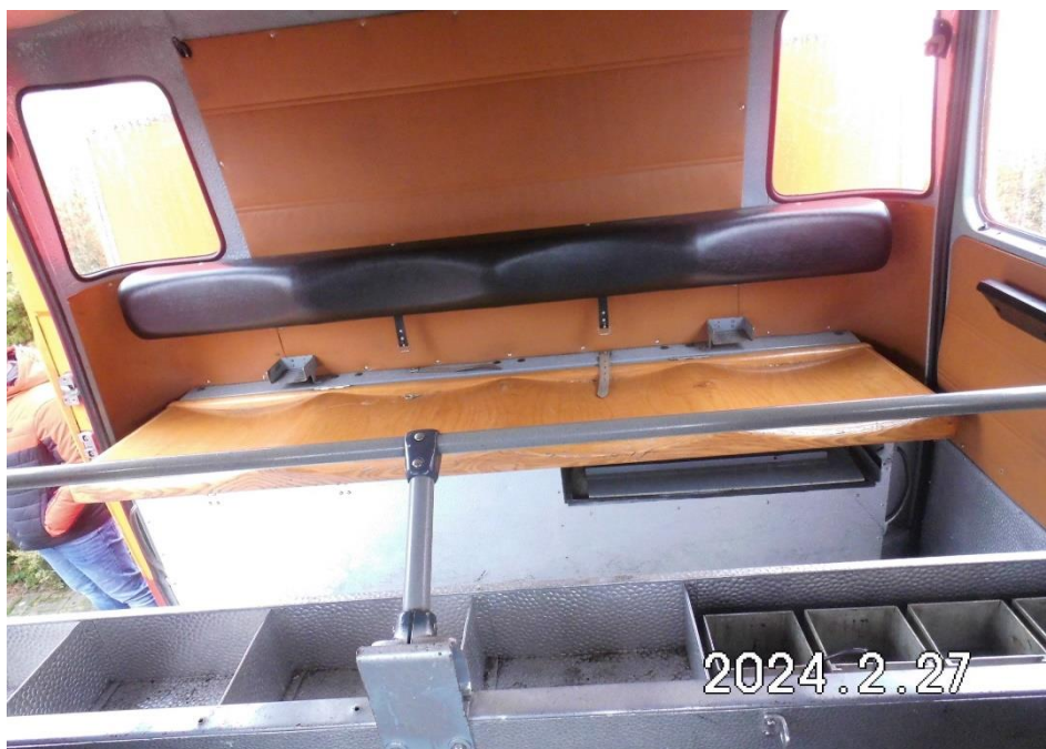
Zdj. 9. Przedział osobowy.