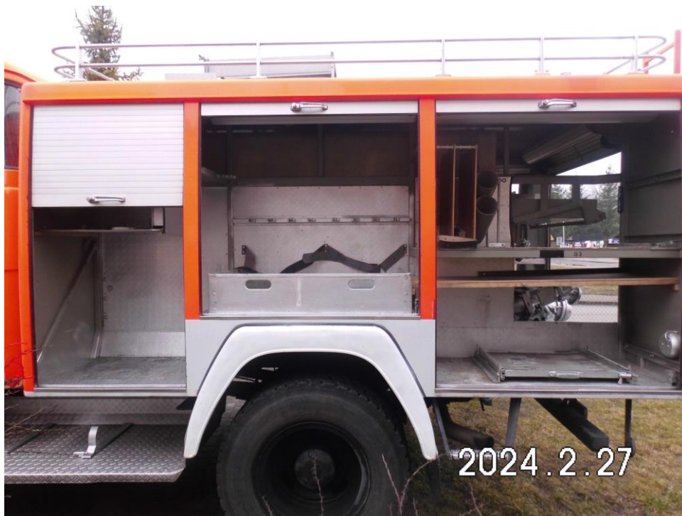
Zdj. 7. Zabudowa samochodu.