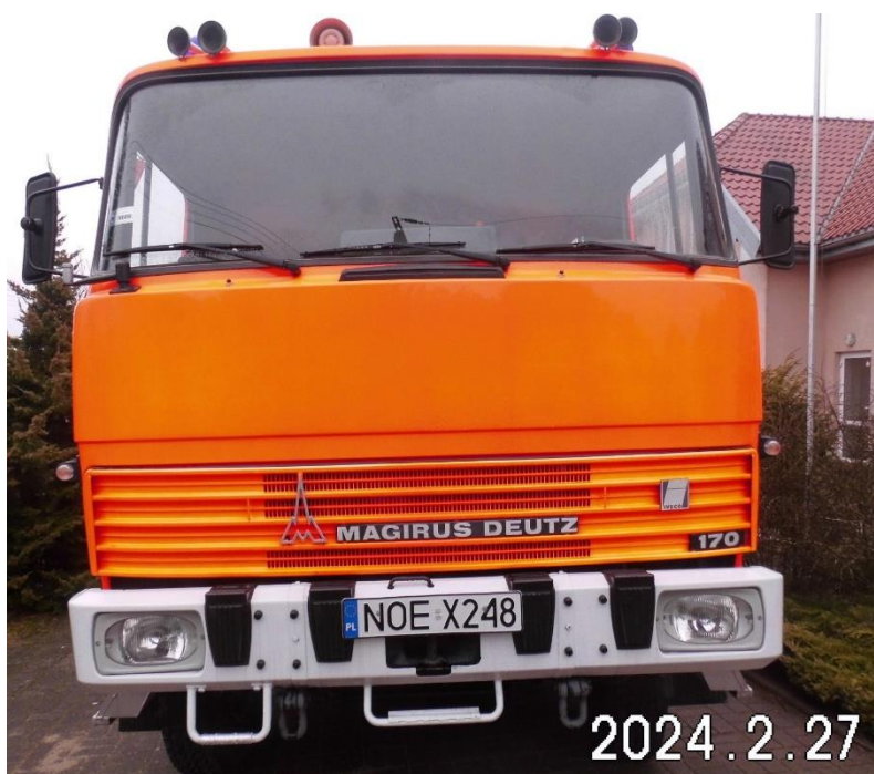
Zdj. 1. Pojazd podlegający sprzedaży.