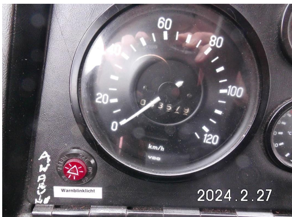
Zdj. 10. Wskazania mechanicznego licznika kilometrów – 33 579 km.