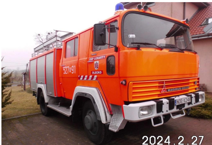
Zdj. 3. Pojazd podlegający sprzedaży.