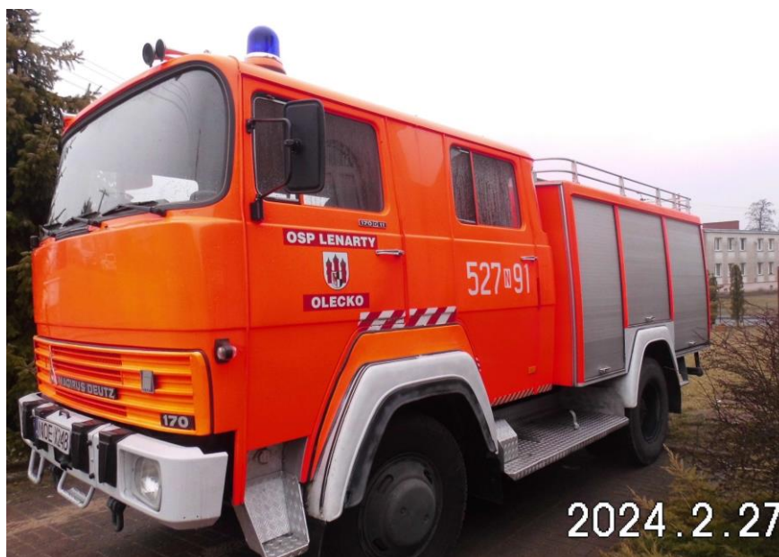
Zdj.4. Pojazd podlegający sprzedaży.