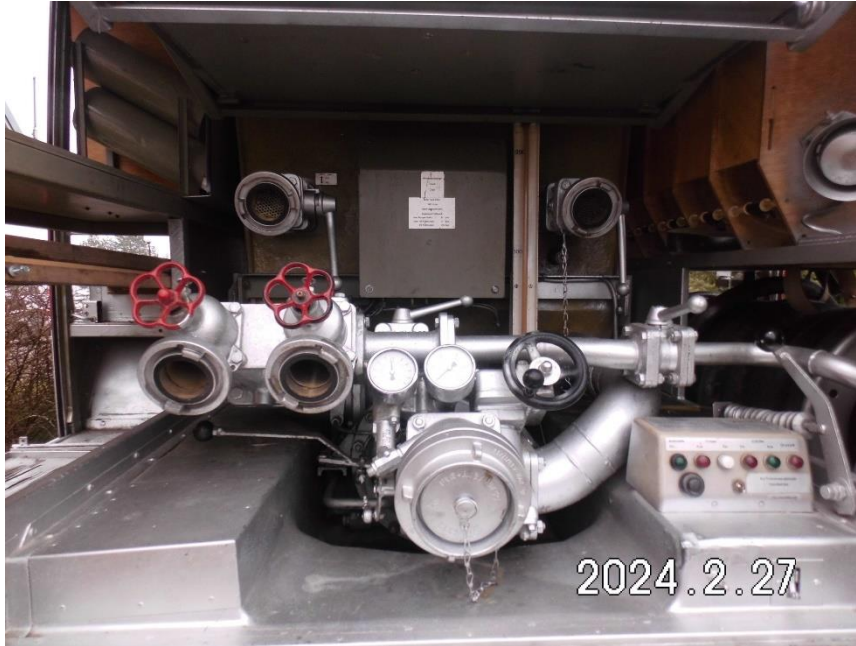
Zdj. 5. Pompa z tyłu pojazdu po kapitalnym remoncie.