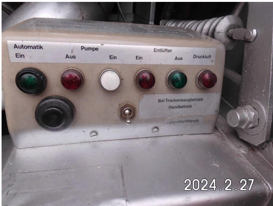
Zdj. 6. Układ sterowania pompą wodną.