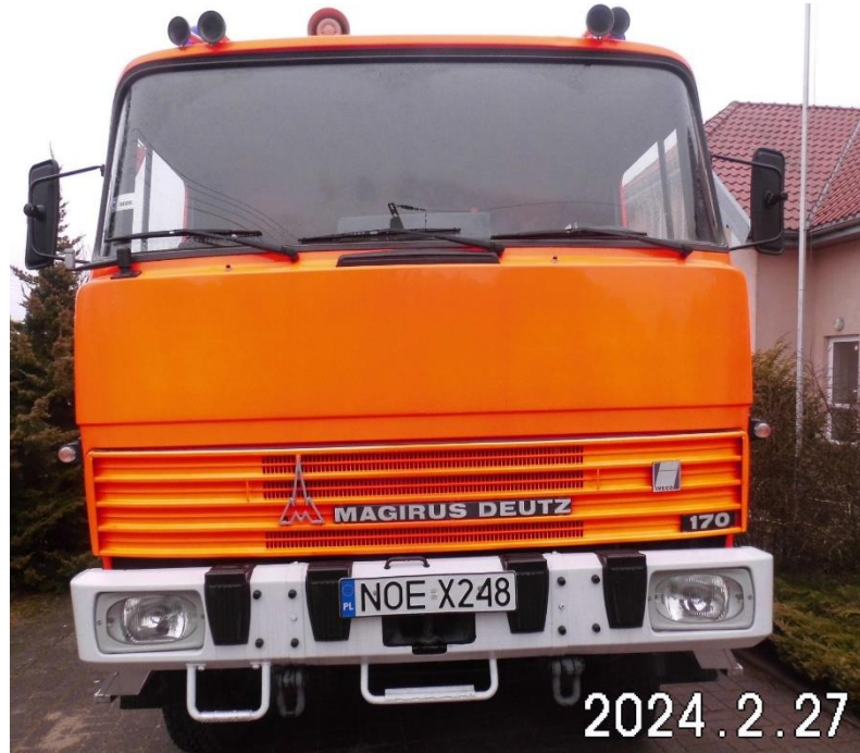
Zdj. 1. Pojazd podlegający sprzedaży