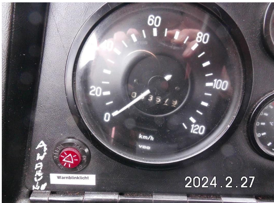
Zdj. 10. Wskazania mechanicznego licznika kilometrów – 33 579 km.