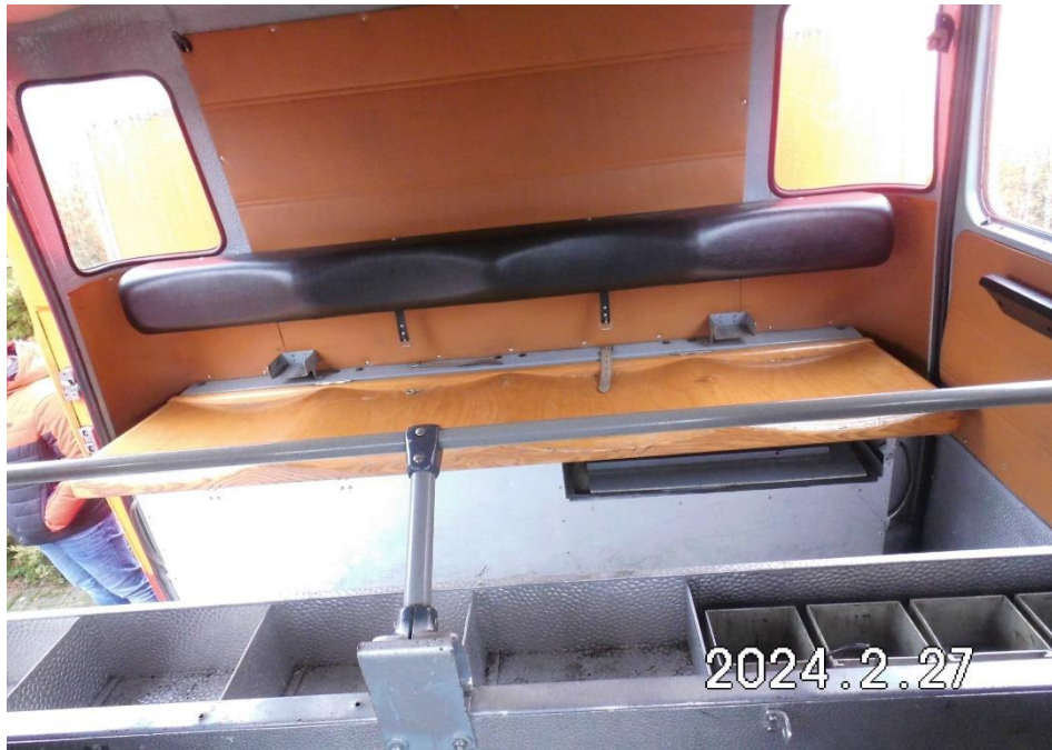
Zdj. 9. Przedział osobowy.