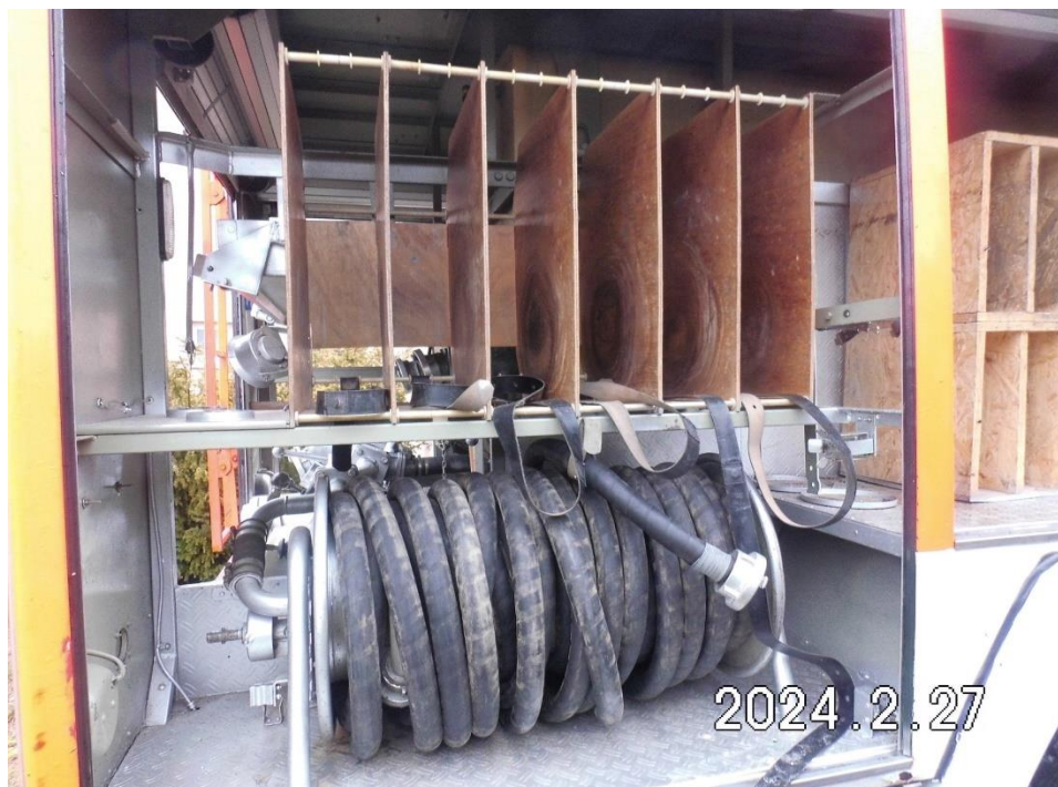
Zdj. 7. Zabudowa samochodu.