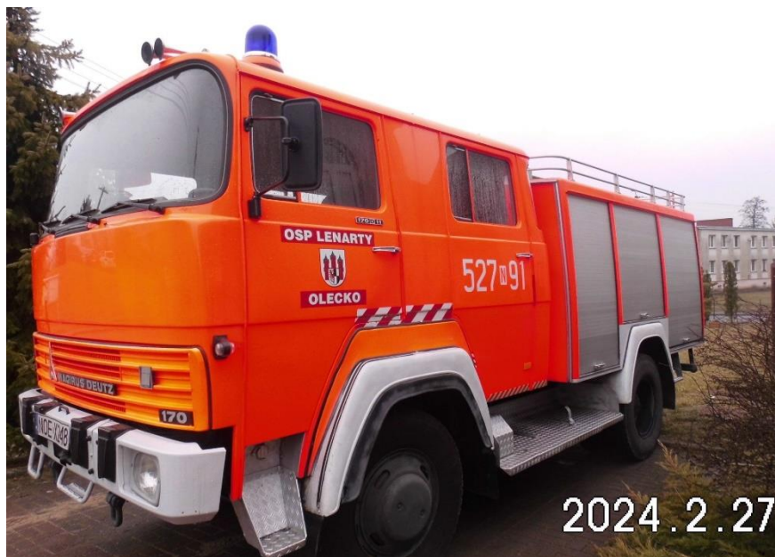
Zdj. 3. Pojazd podlegający sprzedaży.