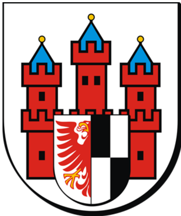
Rysunek 2 Herb miasta Olecko