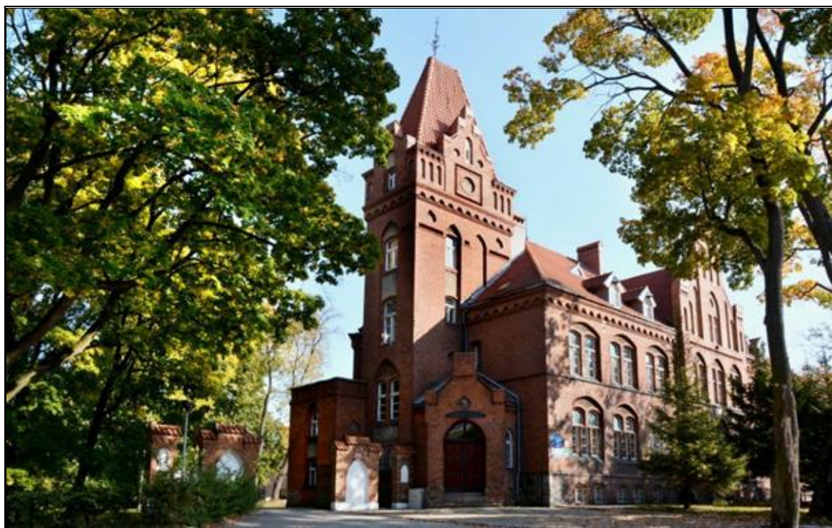
Rysunek 6. Budynek dawnego starostwa powiatowego w Olecku