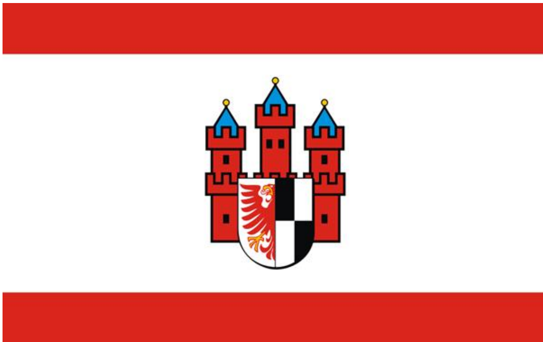
Rysunek 3. Flaga miasta Olecko

Flaga miasta Olecka przedstawia na płacie białym z dwoma wąskimi poziomymi pasami czerwonymi u góry i na dole flagi, herb miasta bez tarczy położony centralnie.