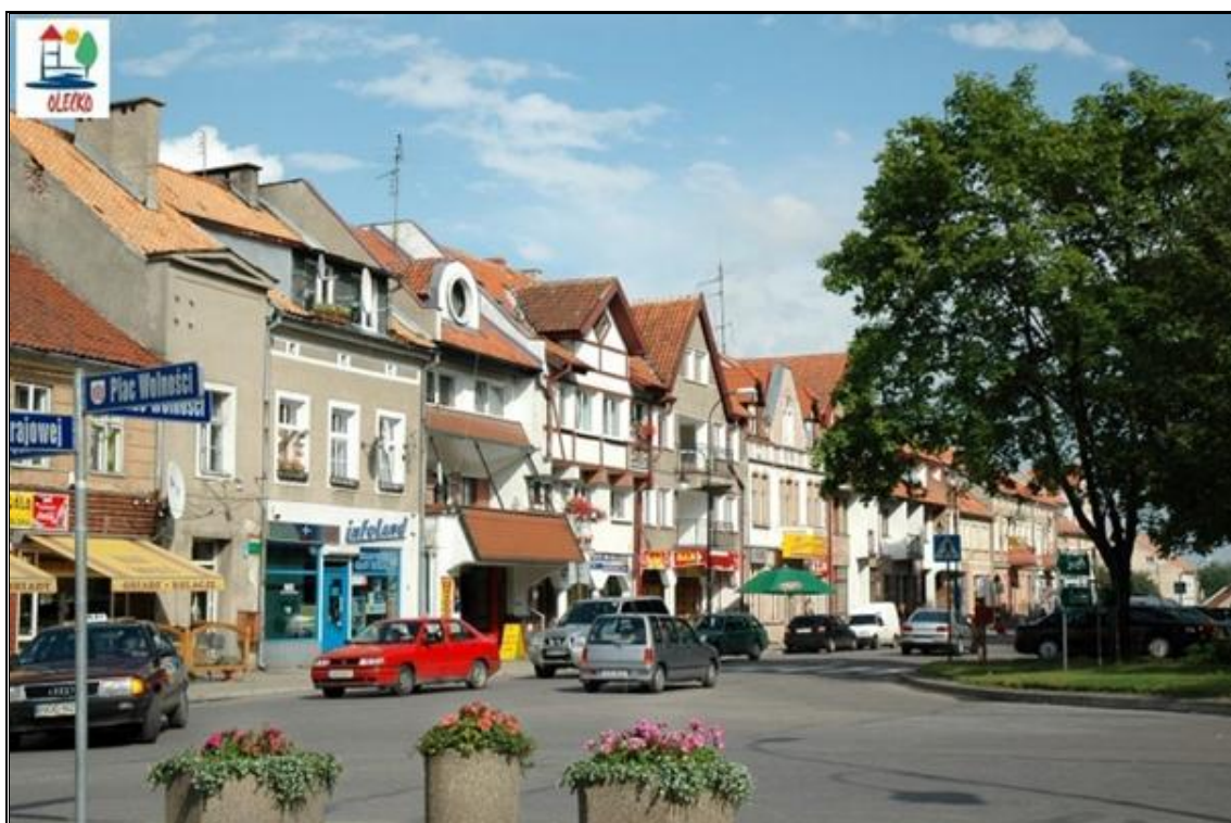
Rysunek 19. Zabudowa przy Placu Wolności w Olecku