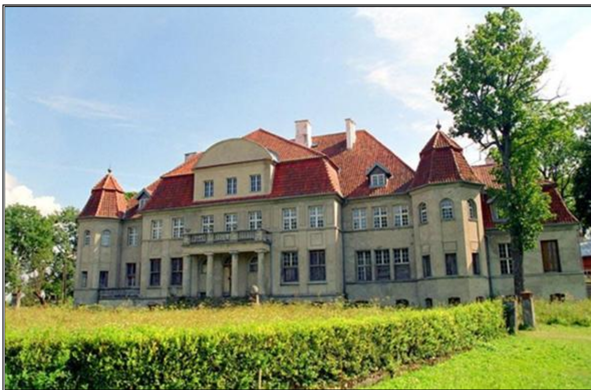
Rysunek 8. Dwór w Białej Oleckiej