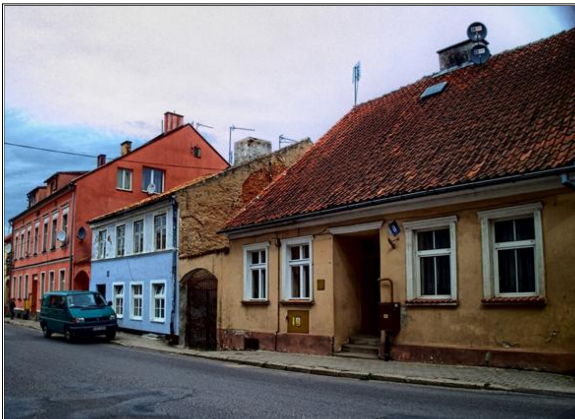
Rysunek 17. Zabudowa przy ul. Armii Krajowej w Olecku