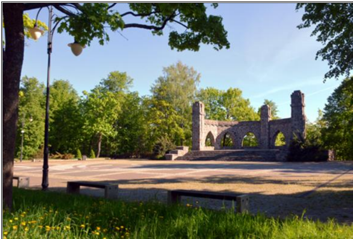
Rysunek 11. Pomnik poświęcony poległym w I wojnie światowej znajdujący się w Parku miejskim w Olecku