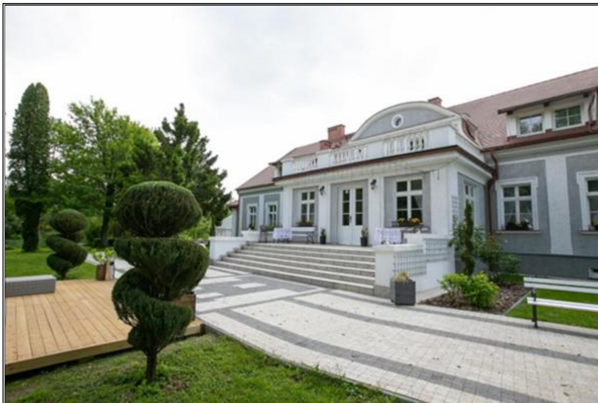
Rysunek 10. Dwór w Siejniku