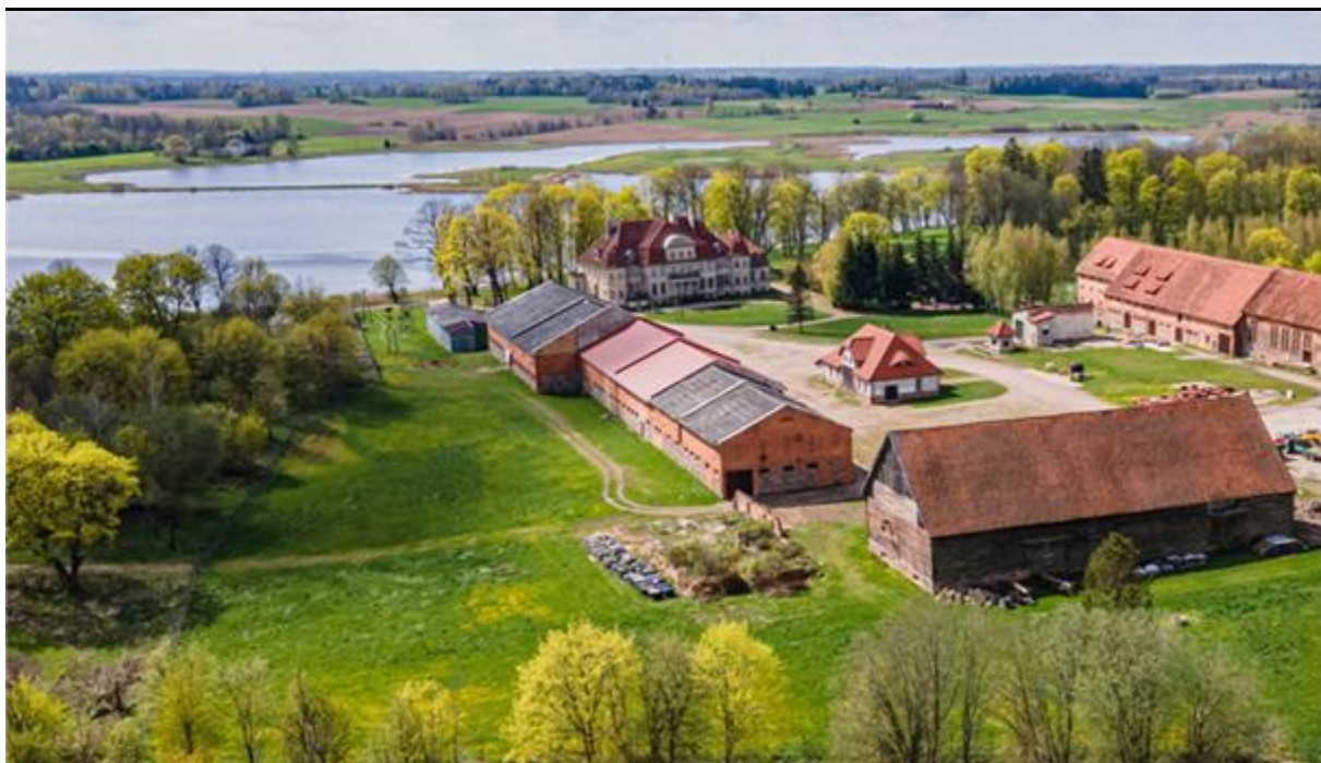
Rysunek 7. Zespół Pałacowy na terenie gminy Olecko – teren Muzeum Motoryzacji