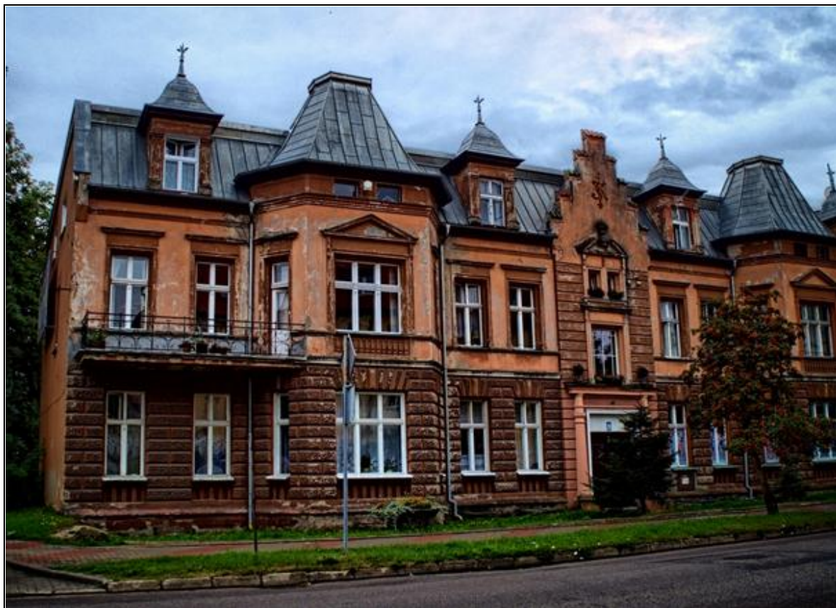
Rysunek 18. Budynek przy ulicy Kolejowej 29 w Olecku