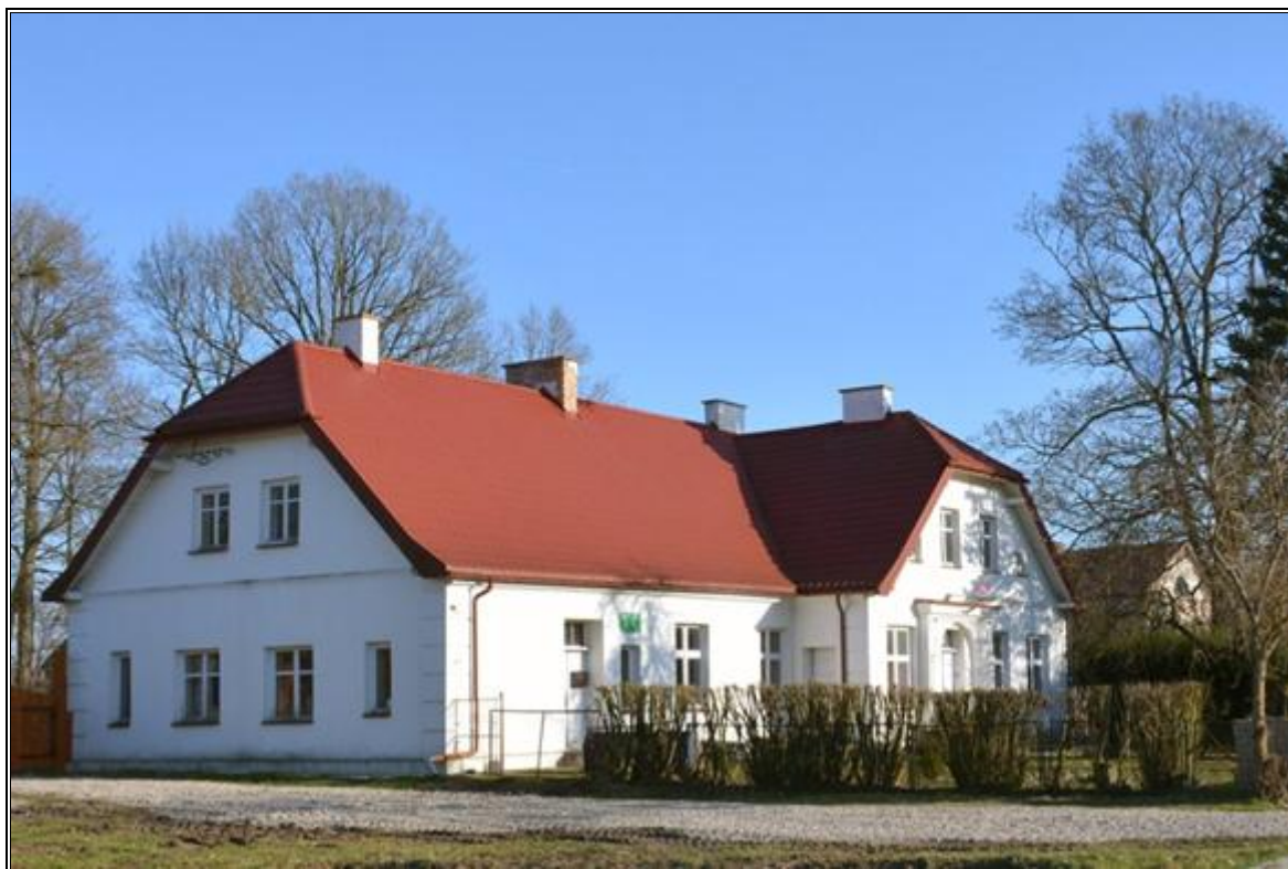
Rysunek 9. Dwór w Gordejkach Małych