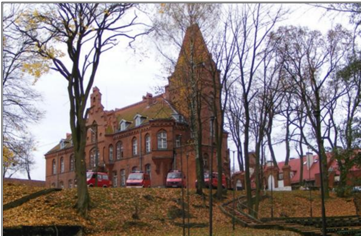
Rysunek 16. Budynek dawnego starostwa w Olecku