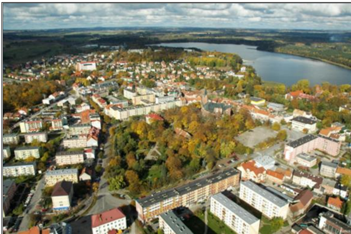
Rysunek 15. Zabytkowa część miasta w Olecku