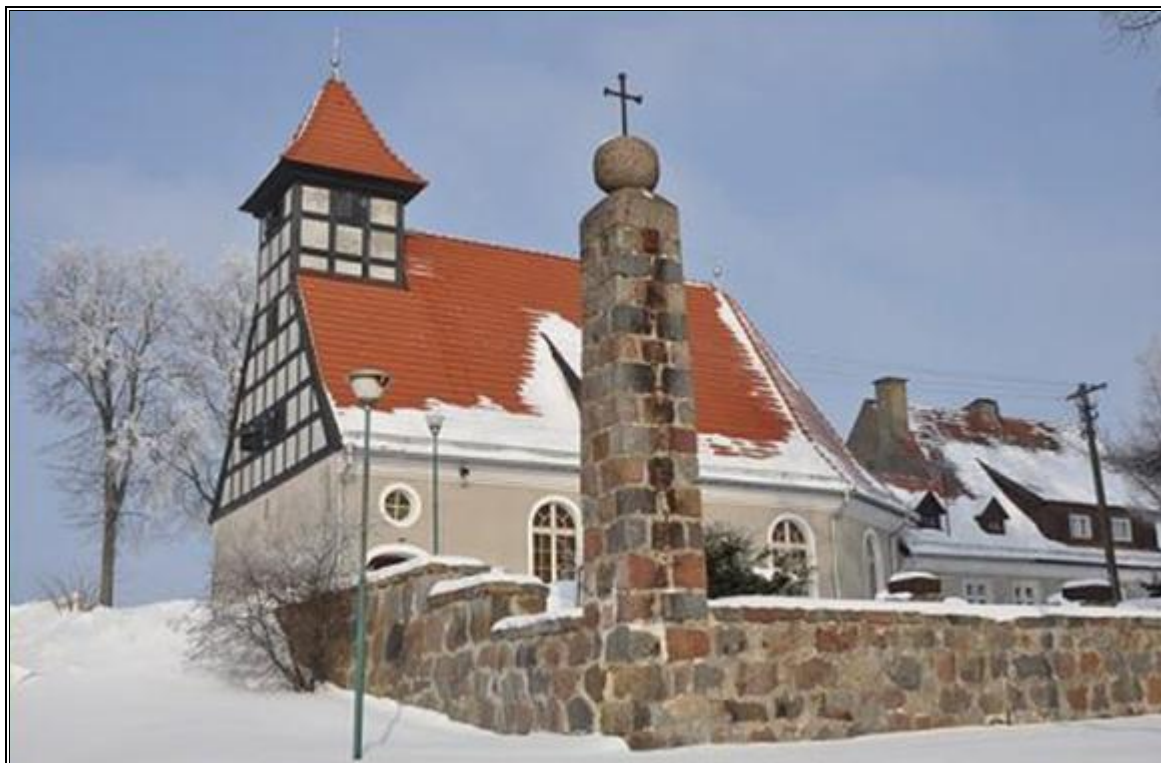
Rysunek 14. Kościół Ewangelicki pw. Św. Stanisława Biskupa w Szczecinkach